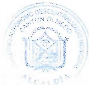
Sr. Fausto Felipe Avilés Saverio ALCALDE DEL CANTÓN OLMEDO

En la ciudad de Olmedo a los veinticinco días del mes de marzo del año dos mil veintiuno. VISTOS: Por cuanto la ORDENANZA QUE ESTABLECE Y CONMEMORA LAS FECHAS CÍVICAS, ACTIVIDADES CULTURALES A CELEBRAR EN EL CANTÓN OLMEDO – MANABÍ , reúne todos los requisitos legales, de conformidad con lo prescrito en el Código Orgánico de Organización Territorial Autonomía y Descentralización, SANCIONO la presente Ordenanza y ordeno su promulgación y publicación de conformidad con el Art. 324 del COOTAD. EJECÚTESE: